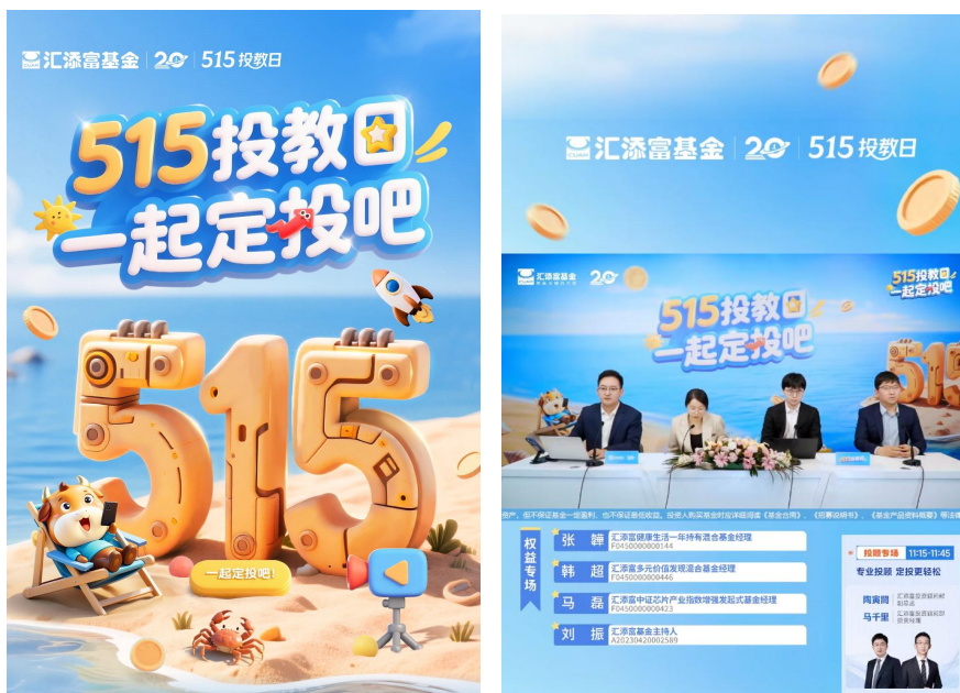
“515 投教日”活动页面&陪伴大直播

“汇玩趣”、“汇好礼”活动则更注重与投资者之间的互动。汇添富以微信公众号、视频号、抖音号和 B 站号为主阵地，结合不同平台的投资者差异画像和平台特色，上线差异化投教内容和互动活动。例如，汇添富基金 CUAM 公众号推出“哪吒定投修行记”沉浸式定投闯关游戏，视频号则开展“定投知识锦囊”答题活动、抖音号发起“定投不停步”打卡挑战赛、B 站号发起话题讨论和“定投公开课”。