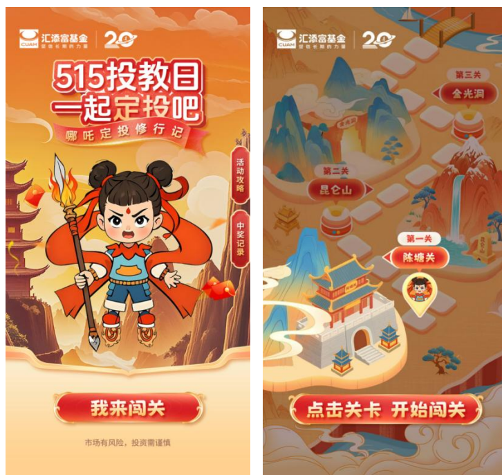
“515 投教日”哪吒定投修行记

“汇玩趣”、“汇好礼”活动则更注重与投资者之间的互动。汇添富以微信公众号、视频号、抖音号和 B 站号为主阵地，结合不同平台的投资者差异画像和平台特色，上线差异化投教内容和互动活动。例如，汇添富基金 CUAM 公众号推出“哪吒定投修行记”沉浸式定投闯关游戏，视频号则开展“定投知识锦囊”答题活动、抖音号发起“定投不停步”打卡挑战赛、B 站号发起话题讨论和“定投公开课”。