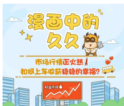
“99 添富节”《漫画中的久久》投教漫画

在直播和内容之外，汇添富还推出多个精彩有趣的投教活动。抖音平台推出“日富一日”计划，每周推出两条超短知识卡片，三周拼出“富有习惯”，通过互动打卡的形式，激励投资者养成投资习惯，学习投资知识。视频号&公众号端，汇添富则推出《久久种树计划》，将连续打卡形式做了具象化处理，用小树的生长进行展现，增加活动视觉效果的同时，也激励投资者的持续参与。