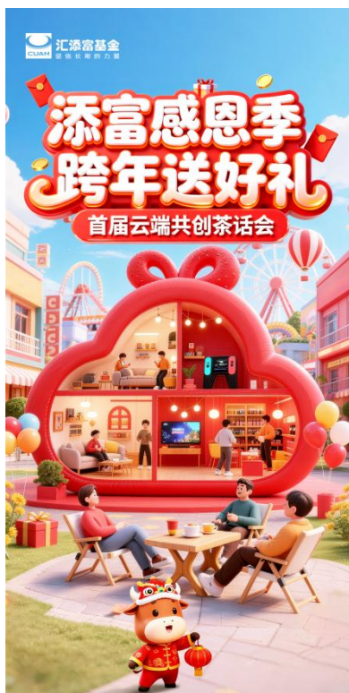
2025 年添富感恩季活动

第二阶段则是全网共同投票阶段，进一步了解投资者的想法和心声。例如公众号推出“添富感恩季用户倾听计划”，通过问卷的形式收集投资者关于投教内容和形式的偏好，为 2026 年的公众号投教内容提供指引和参考；抖音号则开设深度粉丝共创专栏——《我们的投资时代》，邀请投资者分享自己最想搞懂的理财问题或者最想讲的一次投资经历，从而让投资者成为投教活动的核心，从他们的视角讨论投资中的那些事。