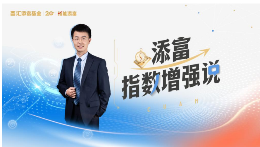
指数主题投教栏目《添富指数增强说》

指数方面也是日常投教的重点之一。《指数增强快问快答》则是指能添富再增强的系列投教课程，全平台累计播放超 40 万次；《ETF 投哪只》每周回顾市场行情，推荐热点指数，2025 年累计播放超 180 万次。