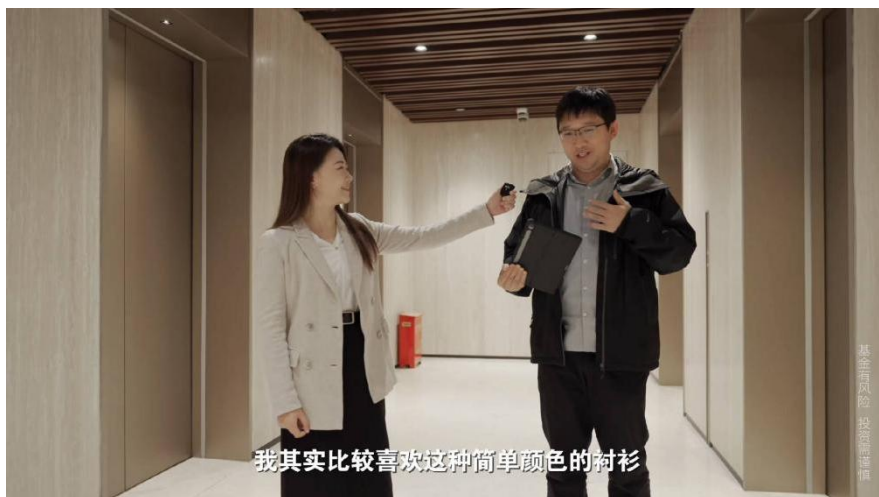
添富感恩季 抖音粉丝共创专栏

第二阶段则是全网共同投票阶段，进一步了解投资者的想法和心声。例如公众号推出“添富感恩季用户倾听计划”，通过问卷的形式收集投资者关于投教内容和形式的偏好，为 2026 年的公众号投教内容提供指引和参考；抖音号则开设深度粉丝共创专栏——《我们的投资时代》，邀请投资者分享自己最想搞懂的理财问题或者最想讲的一次投资经历，从而让投资者成为投教活动的核心，从他们的视角讨论投资中的那些事。