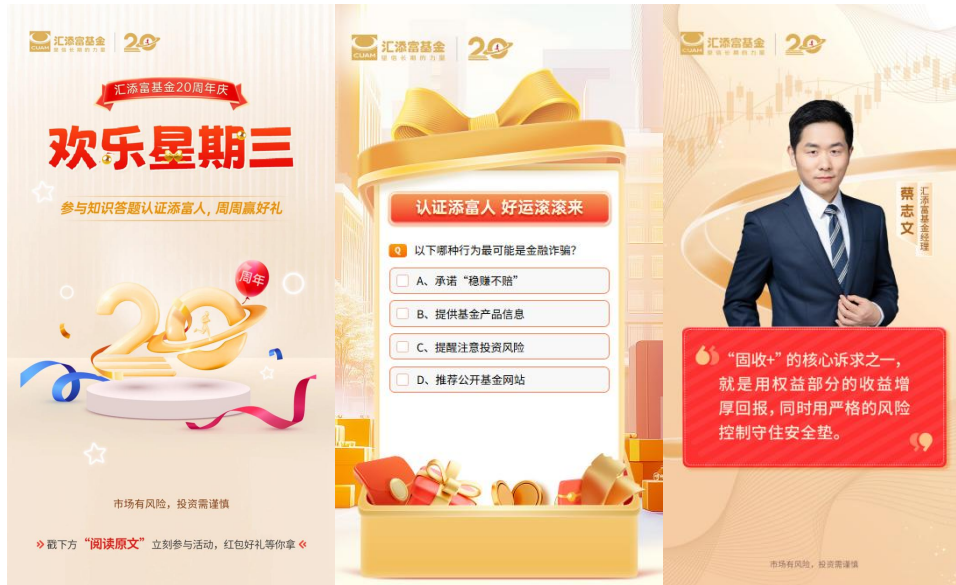
“欢乐星期三”活动页面&基金经理语录卡片