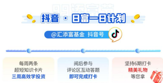
“99 添富节”抖音日复富一日打卡计划

在直播和内容之外，汇添富还推出多个精彩有趣的投教活动。抖音平台推出“日富一日”计划，每周推出两条超短知识卡片，三周拼出“富有习惯”，通过互动打卡的形式，激励投资者养成投资习惯，学习投资知识。视频号&公众号端，汇添富则推出《久久种树计划》，将连续打卡形式做了具象化处理，用小树的生长进行展现，增加活动视觉效果的同时，也激励投资者的持续参与。