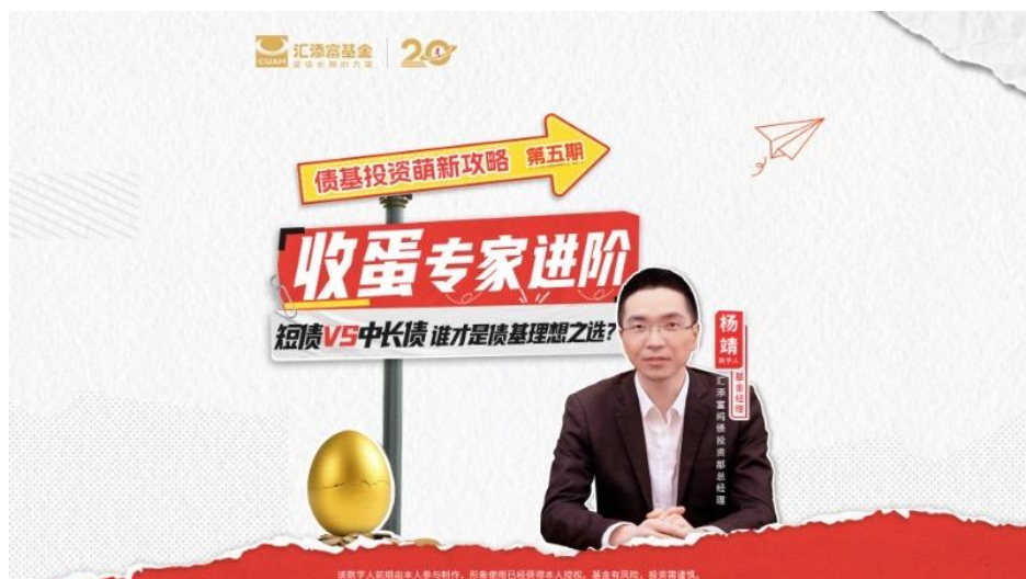
债券主题投教栏目《秒懂债基》

指数方面也是日常投教的重点之一。《指数增强快问快答》则是指能添富再增强的系列投教课程，全平台累计播放超 40 万次；《ETF 投哪只》每周回顾市场行情，推荐热点指数，2025 年累计播放超 180 万次。