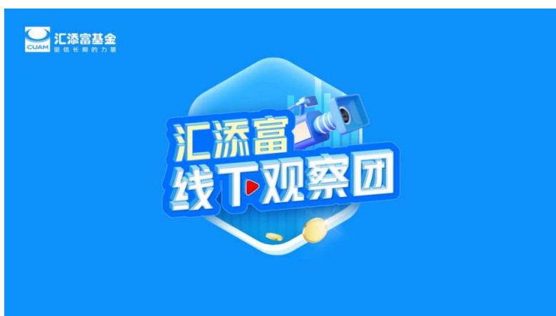
投教栏目《汇添富线下观察团》

《汇添富线下观察团》更注重日常生活，走进人间烟火，跟我去线下，去看最生动鲜活的消费动态，全平台累计播放超 32 万次；