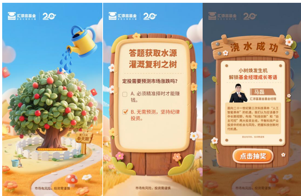
“99 添富节”《久久种树计划》

相较于传统的投教内容输出，2025 年的“99 添富节”，实现从侧重“传播”到侧重“互动”的转变，改“广度曝光”模式为“深度运营”模式。结合不同投资者群体画像和平台特色，上线差异化投教内容，有效提高了投资者的学习热情，提升了投教服务的延续性，也为投教事业的长期发展提供了新范式。此次活动在不同投资者群体中获得广泛传播，累计曝光超 1500 万次。