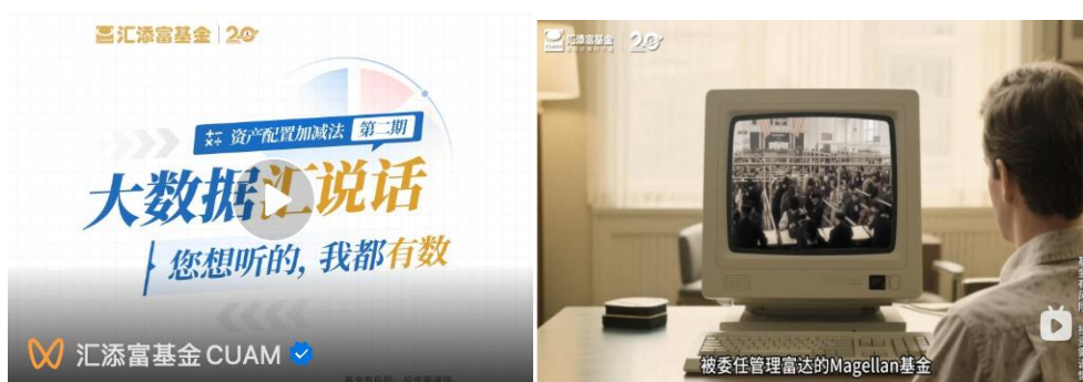
“99 添富节”《大数据汇说话》&《久久故事汇》

科普相结合，密集推出《大数据汇说话-资产配置加减法》《外马路观察室-久久特别版》《久久故事汇》《漫画中的久久》等精品投教栏目，着眼长期投教，引导投资者长期学习、深入思考。