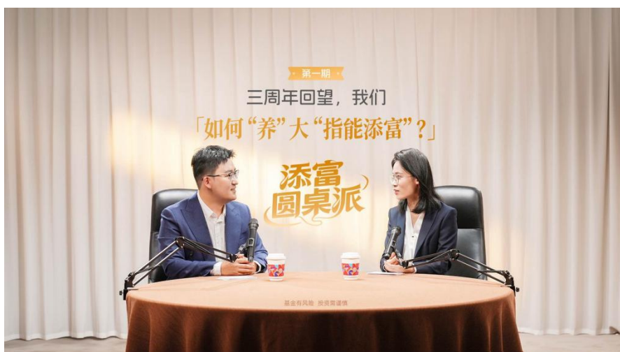
深度对话栏目《添富圆桌派》

《添富圆桌派》定位一档深度对话栏目，通过深度对话与思想碰撞，生动演绎公司投研文化与长期投资理念，全平台累计播放量超 50 万次。