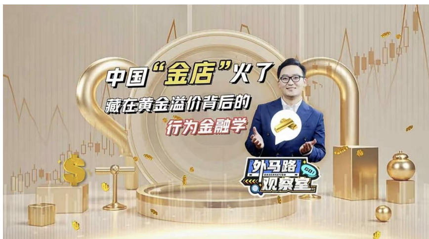
视频投教栏目《外马路观察室》

《添富圆桌派》定位一档深度对话栏目，通过深度对话与思想碰撞，生动演绎公司投研文化与长期投资理念，全平台累计播放量超 50 万次。