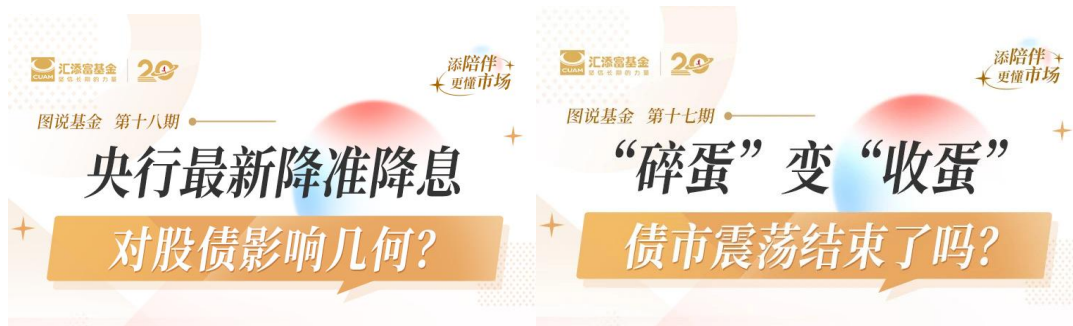
图文投教栏目《图说基金》

同时，汇添富积极联手权威媒体平台打造投教品牌栏目，比如在上海证券报开设《投资洞察》专栏，让基金经理以深入浅出的文字分析宏观经济、解读重大政策、评述经济事件，使读者能够第一时间了解汇添富的投资观点。公司领导与优秀基金经理还多次参与上海市基金同业公会组织的《基金时间》投教节目，为电视观众带去专业市场观察。