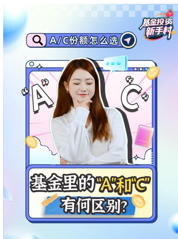
投教栏目《基金投资新手村》

在抖音平台，汇添富更是推出《基金投资新手村》。针对“新手投资者”，通过深入浅出方式带领用户探索基金投资，2025 年全平台累计播放超 450 万次；