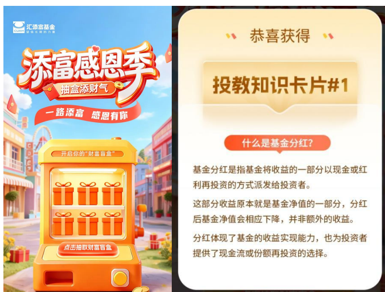
添富感恩季《财富盲盒活动》&投教知识卡片

跨年的添富感恩季，不仅是一次对于投资者和用户的回馈，更打破了以往投教内容单向输出的模式，是一次让投资者作为投教的发起点，倾听投资者声音的“共创”盛宴。据统计，本次感恩季“首届云端共创茶话会”曝光超 730 万次。